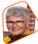
Ria de Wahl